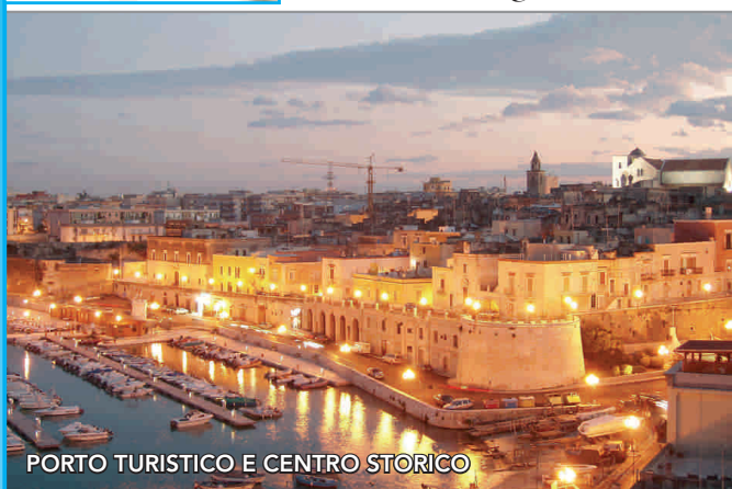
PORTO TURISTICO E CENTRO STORICO

Uno splendido omaggio per tutti i partecipanti, una bottiglia-degustazione di olio extravergine d'oliva