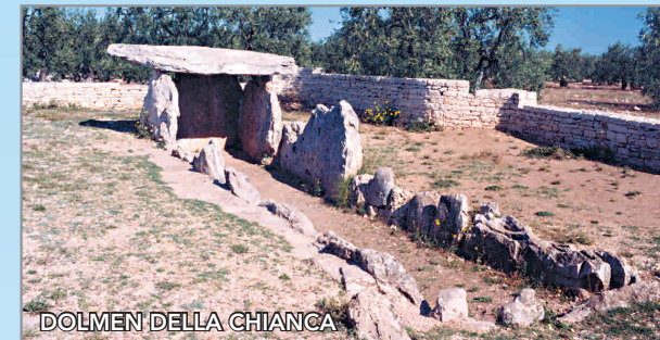
DOLMEN DELLA CHIANCA

Al mattino si parte alla volta delle campagne per partecipare alla raccolta delle olive. Anziani contadini illustreranno le tecniche di coltivazione dell'olivo che si tramandano da diversi secoli: Bisceglie è nota per la raccolta eseguita categoricamente a mano, senza ausili meccanici,